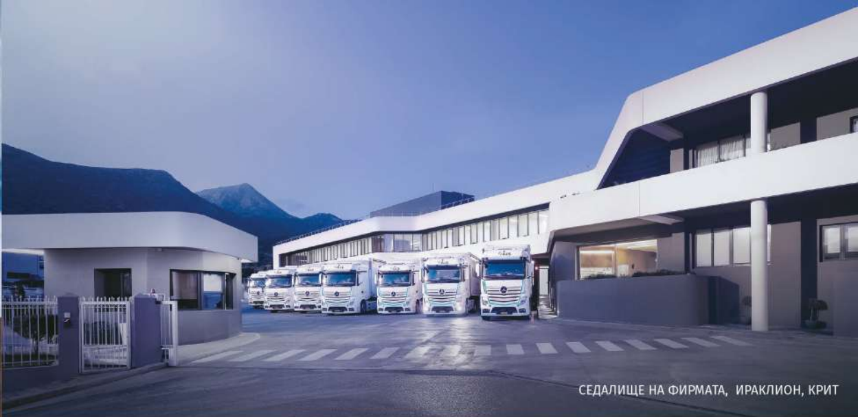
СЕДАЛИЩЕ НА ФИРМАТА, ИРАКЛИОН, КРИТ

С 45 години успешно присъствие на пазара KOUVIDIS е един от водещите производители на пластмасови тръбни системи за защита на кабели, канализация и дренаж в Европа.